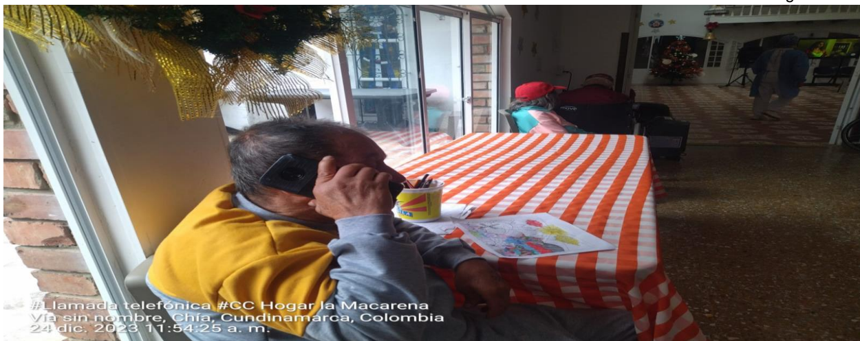
#Llamada telefónica #CC Hogar la Macarena Vía sin nombre, Chía, Cundinamarca, Colombia 24 dic. 2023 11:54:25 a. m.