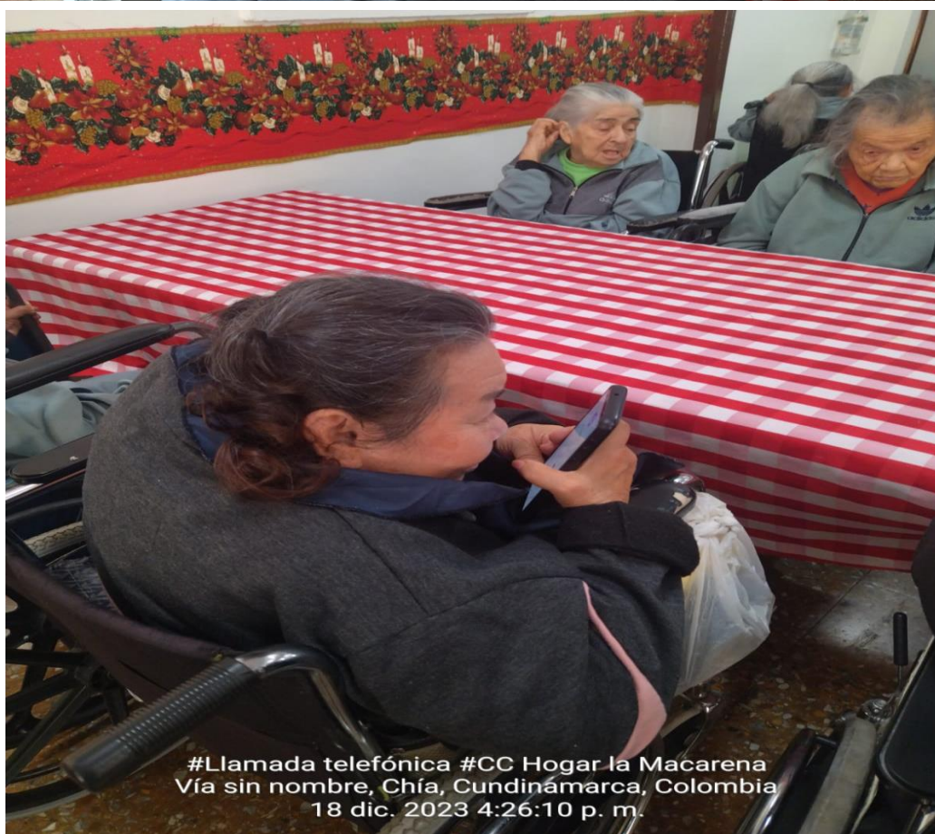
#Llamada telefónica #CC Hogar la Macarena Vía sin nombre, Chía, Cundinamarca, Colombia 18 dic. 2023 4:26:10 p. m.